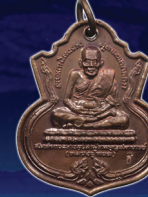
สร้าง 1,999 ชุด บูชาชุดละ 299 บาท (ใกล้หมด)