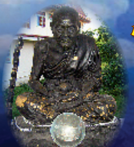
หลวงปู่ขาว เข้ยมบ้น้ำทะเลจืด วัดนครราชสีมา (เกาะลอย) ของความมหัศจรรย์

ขอเชิญทุกท่านร่วมบุญบารมีของพร หลวงปู่ขาว เข้ยมบ้น้ำทะเลจืดปางอุตงค์ (ปางแห่งโชคสาม) โดยการบรรจุกรุพระหลวงปู่ขาวเนื้อผง ลงในแท่งประดิษฐานหลวงปู่ขาว เพื่อให้เป็นประวัติศาสตร์สืบต่อไป