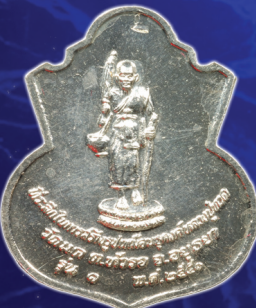
เหรียญเงินลงยาสีเหลืองบุษราคัม (แจกกรรมการ) บูชาเหรียญละ 1,500 บาท