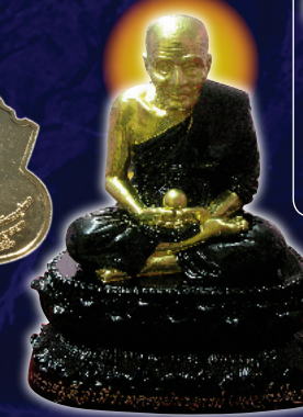
หลวงปู่ขาว ประทับนั่ง ปิงทอง ขนาด 3 นิ้ว สร้าง 200 องค์ บูชา 2,299 บาท