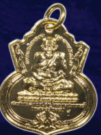
สร้าง 1,999 ชุด บูชาชุดละ 599 บาท (ใกล้หมด)