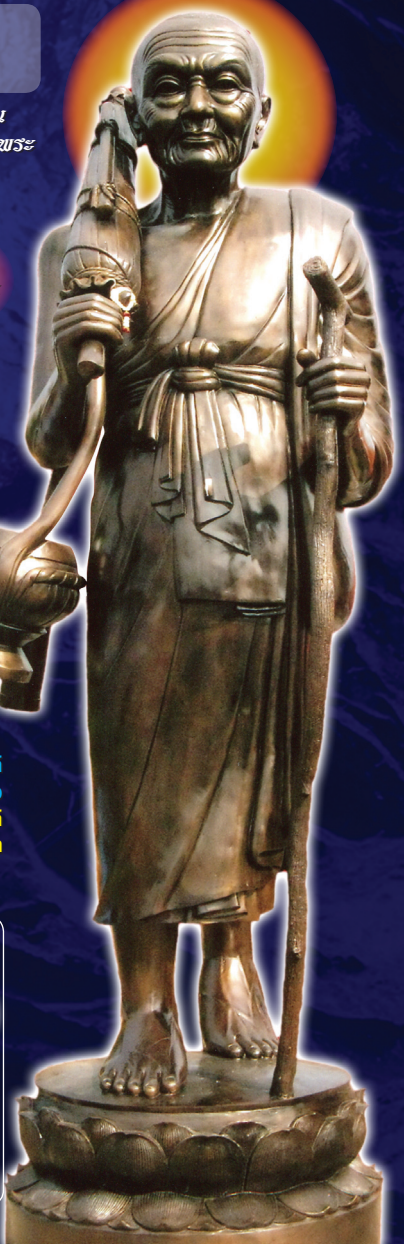
หลวงปู่ขาวปางอุตงค์ (ปางแห่งโชคสาม) สูงที่สุดในโลก - สูงกว่า 5 เมตร