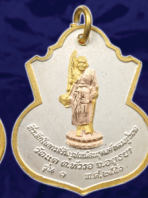
เหรียญสามกษัตริย์ทอง เงิน นาก