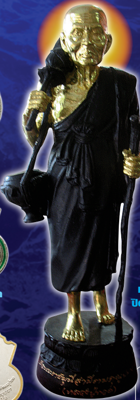
เปิดประวัติศาสตร์ หลวงปู่ขาว เข้ยมบ้น้ำทะเลจืด แห่งกรุงศรีอยุธยา